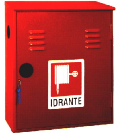
Modello TEXAS 45 S