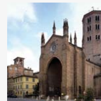
Piacenza 13 giugno 2018