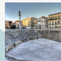
Lecce 10 ottobre 2018