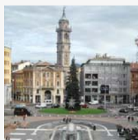
Varese 6 aprile 2018