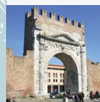
Rimini 11 maggio 2018