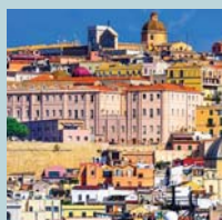
Cagliari 14 febbraio 2018