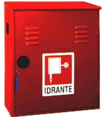
Modello TEXAS 45S